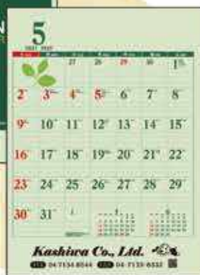
グリーンカレンダー