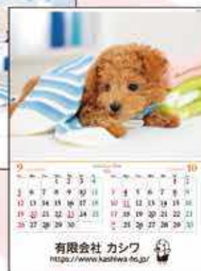
ワンニャン・パーク

他にも沢山の種類のカレンダーをご用意しております。また、1から作成する完全オリジナルカレンダーも作成できますので、ぜひお気軽にお問合せくださいませ！